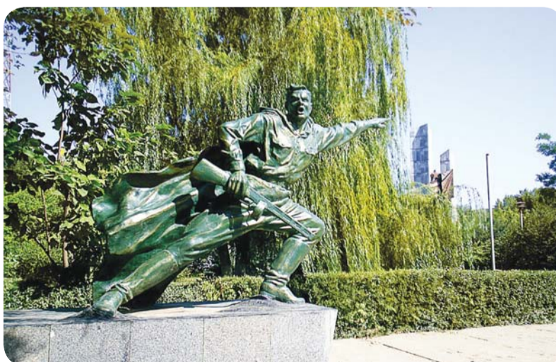
Памятник Неизвестному Солдату.