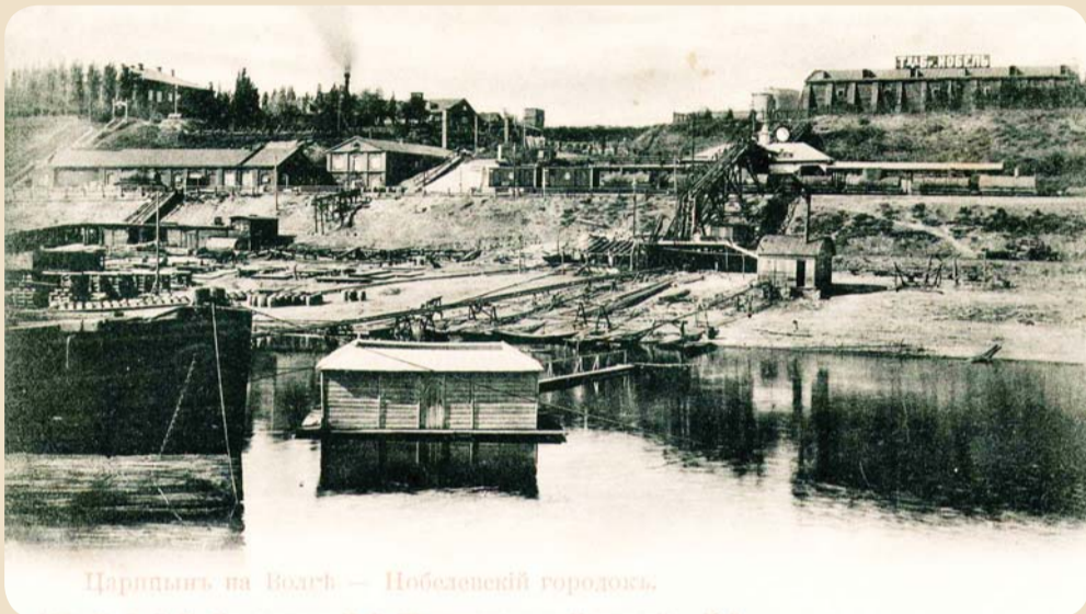
Царыцынь на Волге – Нобелевский городок.

31 марта – особая дата для Волгоградской энергетики. Именно в этот день, 80 лет назад, вышло Постановление краевого исполкома об образовании Сталинградской энергосистемы. Первым шагом в реализации постановления стало соединение линиями электропередачи напряжением 110 кВ подстанций «Тракторная» и «Северная» со СталГРЭС и образование первого электросетевого предприятия в составе объединённой региональной энергосистемы – Сталинградских электрических сетей. Инициатором и организатором торжеств, посвященных юбилею энергосистемы, стал филиал ОАО «МРСК Юга» - «Волгоградэнерго». Подробности – в нашем фоторепортаже.