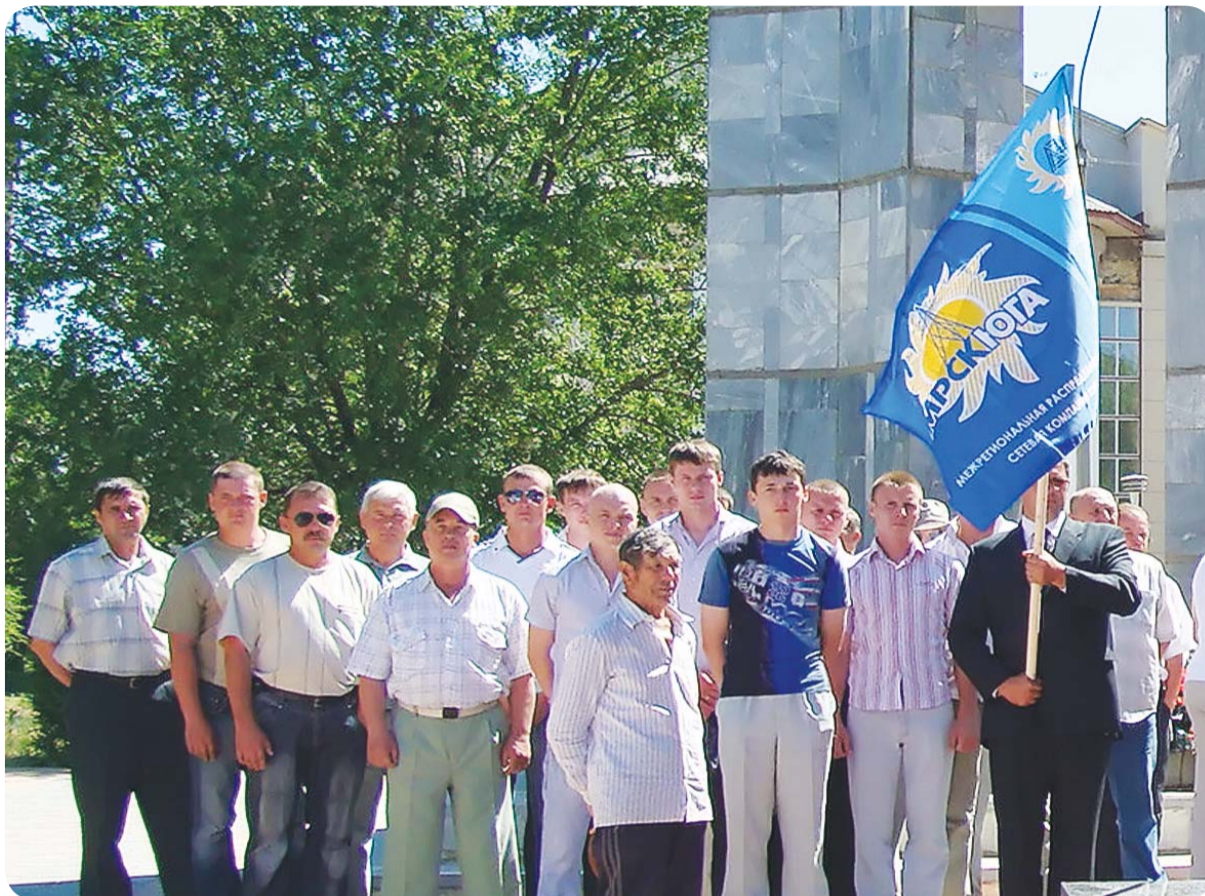
Сотрудники Ахтубинского РЭС на праздничной демонстрации 9 мая 2010 года.

Свое второе свое рождение «Ахтубинские электрические сети» получили с момента выделения Астраханской энергосистемы в са-