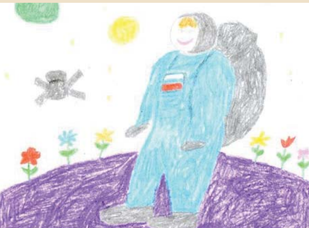
III место – Очирова Лера, 7 лет, «Калмэнерго»