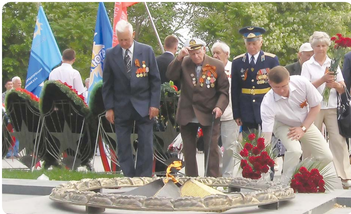
Этап эстафеты Знамени Победы. Астрахань, май 2010 года.

В начале мая стартует патриотическая акция ОАО «Холдинг МРСК» «Эстафета Знамени Победы»