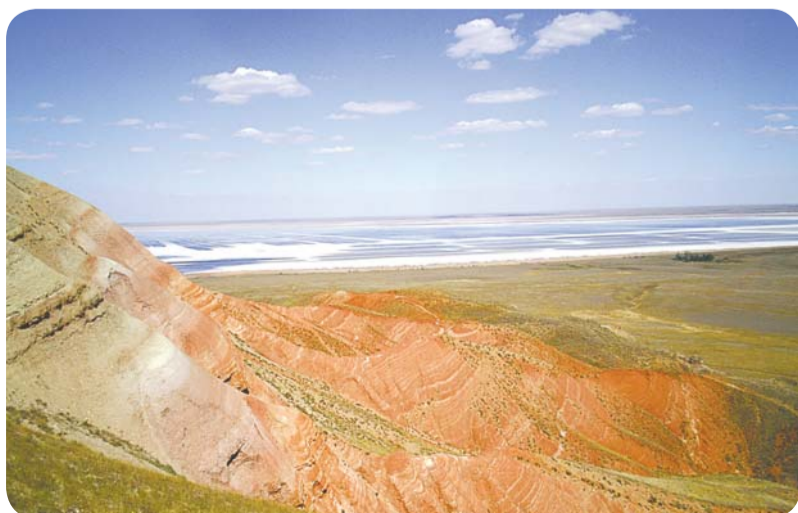
Крупнейшее в России соленое озеро Баскунчак, одна из главных достопримечательностей Ахтубинского района