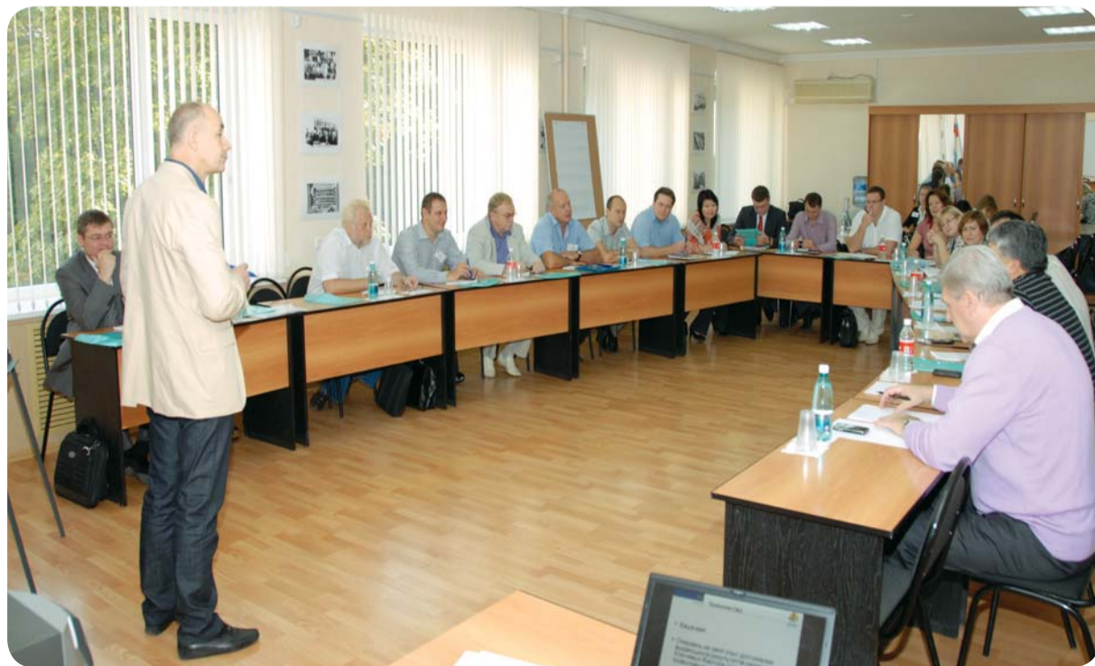
Стратегическая сессия-тренинг. Сентябрь 2010 года.

Утверждены Миссия, Видение, Ценности и Стратегические цели ОАО «МРСК Юга»